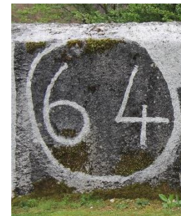
Adishatz a tots (*)

(*) Au revoir à tous (et à bientôt pour d'autres aventures !!!)